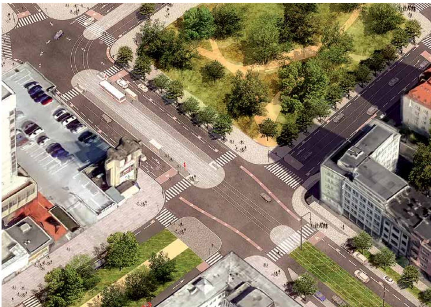
Vizualizace budoucí podoby náměstí Hrdinů.

Křižovatka u stanice metra Pražského povstání a její okolí projdou zásadní proměnou. Jejím cílem je usnadnění přestupu obyvatel Prahy 4 mezi metrem, tramvajemi a autobusy MHD, aby bylo pohodlnější a hlavně bezpečnější, a zlepšení podmínek pro pohyb chodců v této lokalitě. „Chceme náměstí Hrdinů a jeho okolí rehabilitovat, dnes je to jen obtížně průchodná oblast, ve které na sebe navíc dobře nenavazují jednotlivé prostředky veřejné dopravy,“ uvedl starosta Petr Štěpánek (Praha 4 sobě/Zelení). „Prosazujeme proto řadu změn, které přispějí k tomu, aby