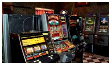
Závislost na hracích automatech způsobila nejednu rodinnou tragédii.

rada učinila toto rozhodnutí, které je v souladu s koaliční smlouvou, v níž se všichni koaliční